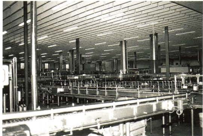
Abfüllanlage mit schallabsorbierender Deckenverkleidung

Die Nachhallzeit ist die gemessene Zeiteinheit, in der ein erzeugtes Geräusch nach dem Abschalten um 60 dB abfällt. Je kürzer die Nachhallzeit, desto größer sind die äquivalenten Absorptionsflächen.